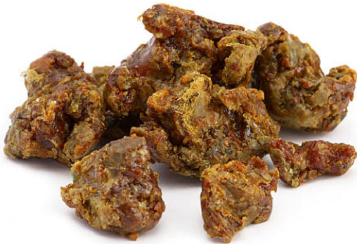
Afbeelding 1. Ruwe propolis

In de studieperiode van 4,5 jaar zijn 3.134 patiënten (69% vrouwen) getest met propolis in de basisreeks. Er waren 299 (9,5%) positieve plakproefreacties, 205 (69%) bij vrouwen en 94 (31%)