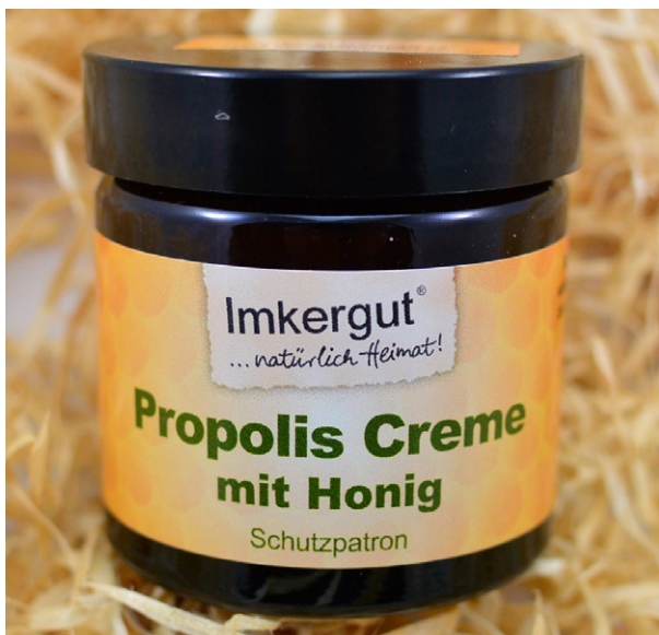
Afbeelding 4. Propolis crème

bij mannen. De percentages positieve reacties per jaar waren 3,4% in 2019 (5,5 maanden), 2,8% in 2020, 6,1% in 2021, 16,1% in 2022 en 16,4% in 2023 (11 maanden). De toename van de percentages positieve reacties van 2020 tot 2023 was statistisch significant. Van de 299 positieve reacties op propolis werden 8 (2,7%) beschouwd als relevant voor de huidige eczeemklachten en 1 (0,3%) verklaarde het optreden van eczeem in het verleden. De hiervoor verantwoordelijke propolis-bevattende producten waren (bio)cosmetica (n=6), voedingssupplementen (n=2) en een lokaal biofarmaceutisch product. De klinische relevantie van de reacties bij de andere 290 patiënten (97%) bleef onbekend. Er waren onder de patiënten geen imkers. 179 van de 299 (60%) patiënten met een positieve reactie op propolis hadden ook een of meer reacties op parfums of indicatoren voor parfumallergie: Myroxylon pereirae hars (perubal-