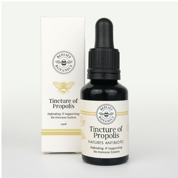
Afbeelding 3. Propolistinctuur