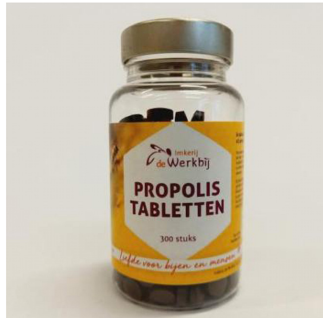
Afbeelding 5. Propolis tabletten als voedingssupplement

bij mannen. De percentages positieve reacties per jaar waren 3,4% in 2019 (5,5 maanden), 2,8% in 2020, 6,1% in 2021, 16,1% in 2022 en 16,4% in 2023 (11 maanden). De toename van de percentages positieve reacties van 2020 tot 2023 was statistisch significant. Van de 299 positieve reacties op propolis werden 8 (2,7%) beschouwd als relevant voor de huidige eczeemklachten en 1 (0,3%) verklaarde het optreden van eczeem in het verleden. De hiervoor verantwoordelijke propolis-bevattende producten waren (bio)cosmetica (n=6), voedingssupplementen (n=2) en een lokaal biofarmaceutisch product. De klinische relevantie van de reacties bij de andere 290 patiënten (97%) bleef onbekend. Er waren onder de patiënten geen imkers. 179 van de 299 (60%) patiënten met een positieve reactie op propolis hadden ook een of meer reacties op parfums of indicatoren voor parfumallergie: Myroxylon pereirae hars (perubal-